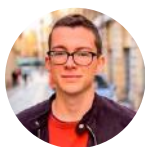
Formateur : AXEL DESIGNER GRAPHIQUE

Dans ce cours, vous allez apprendre à utiliser Adobe XD par la pratique, en se basant sur la création d'un projet d'application mobile. Tout au long de celui-ci, nous utiliseront les meilleures fonctionnalités d'Adobe XD comme : • Grille de répétition • Les Actifs (couleurs, polices de caractères, symboles) • Les plugins • Les éléments fixés • Les overlays (incrustation) • Le prototyping • Les animations automatiques